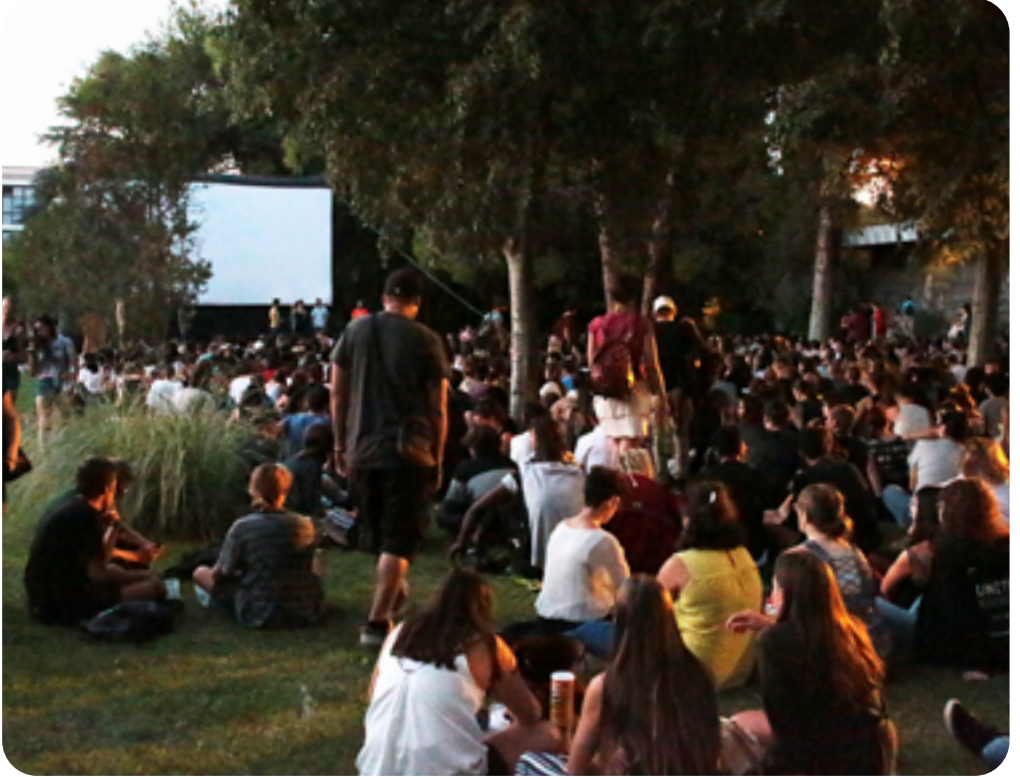
Parc du Musée