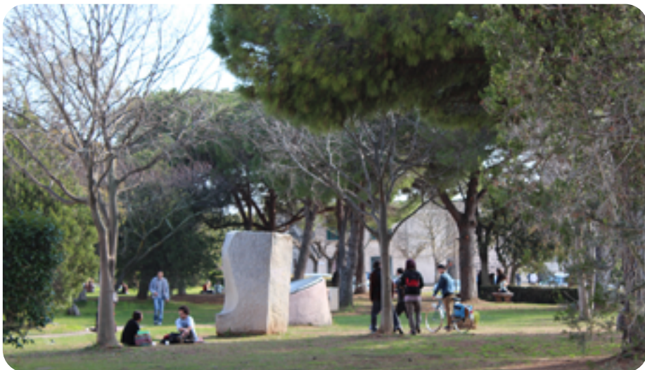
Parc du Musée